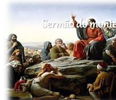
Sermão do monte