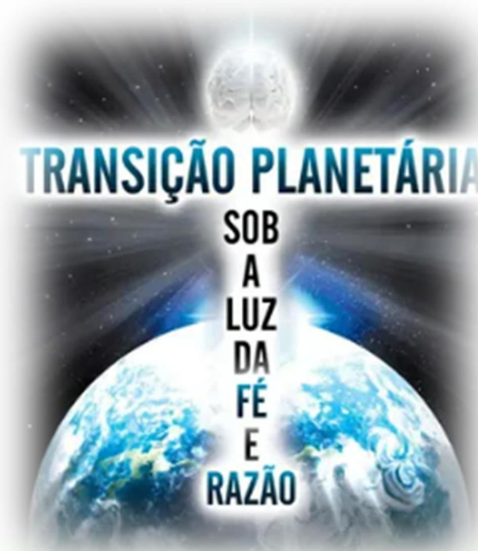
Capa do livro de José Silvério Alves, 2024