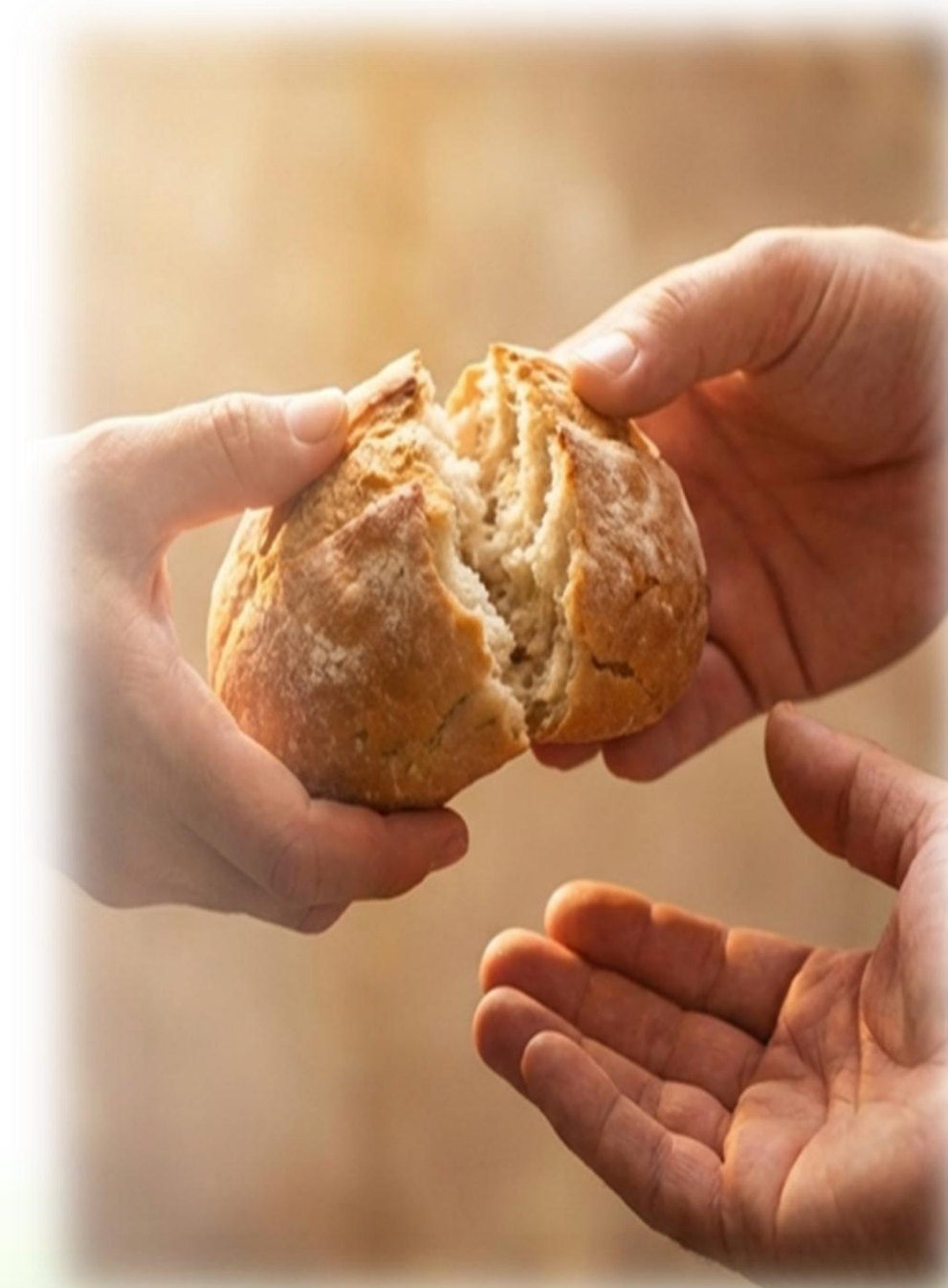
Figura gerada IA manus.im em 20/03/26