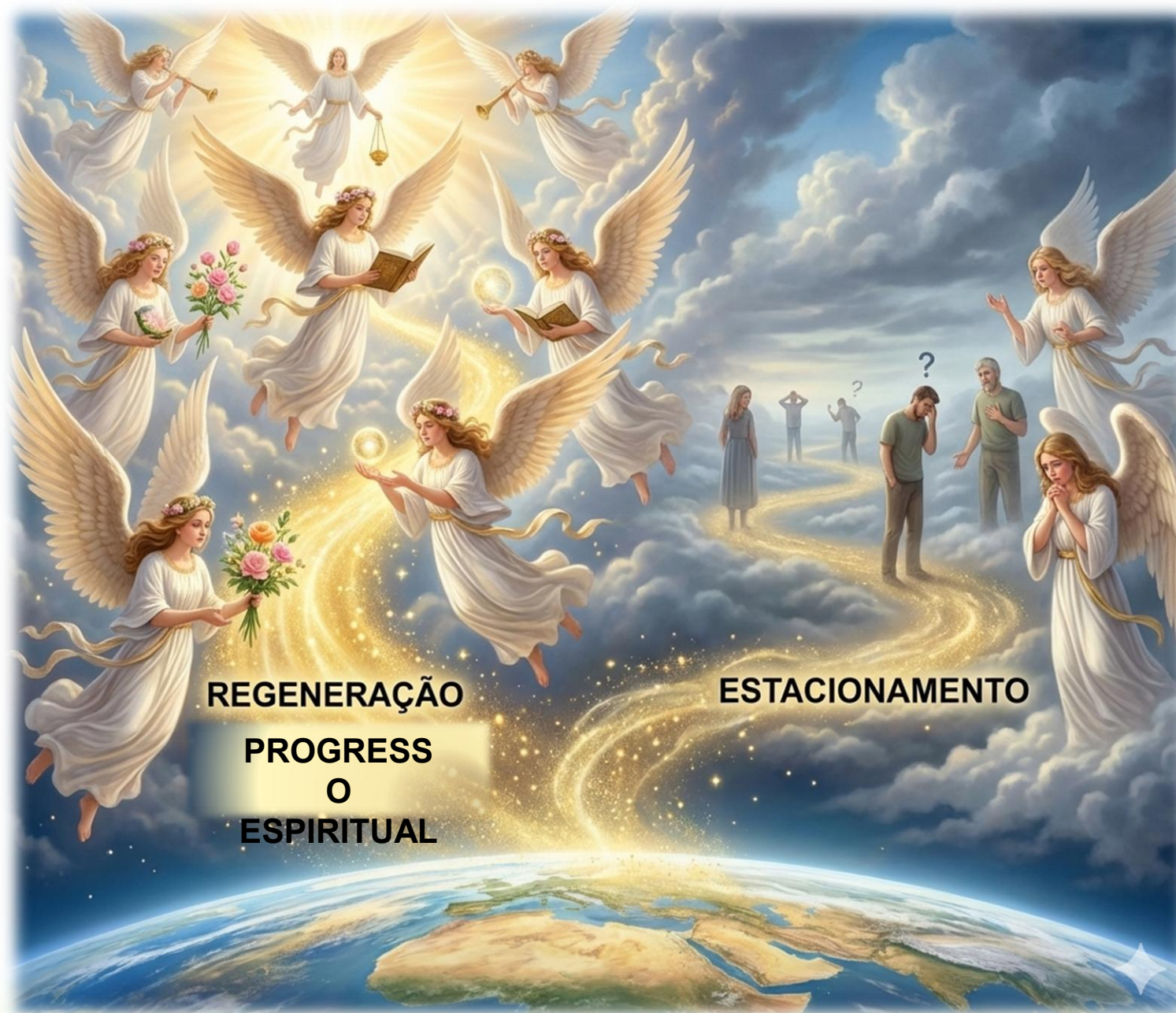
Figura gerada IA google em 21/03/26

Já despertamos? Temos consciência da necessidade de servir na Seara do Cristo? Do nosso compromisso com o estar Vivo?