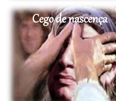
Cego de nascença