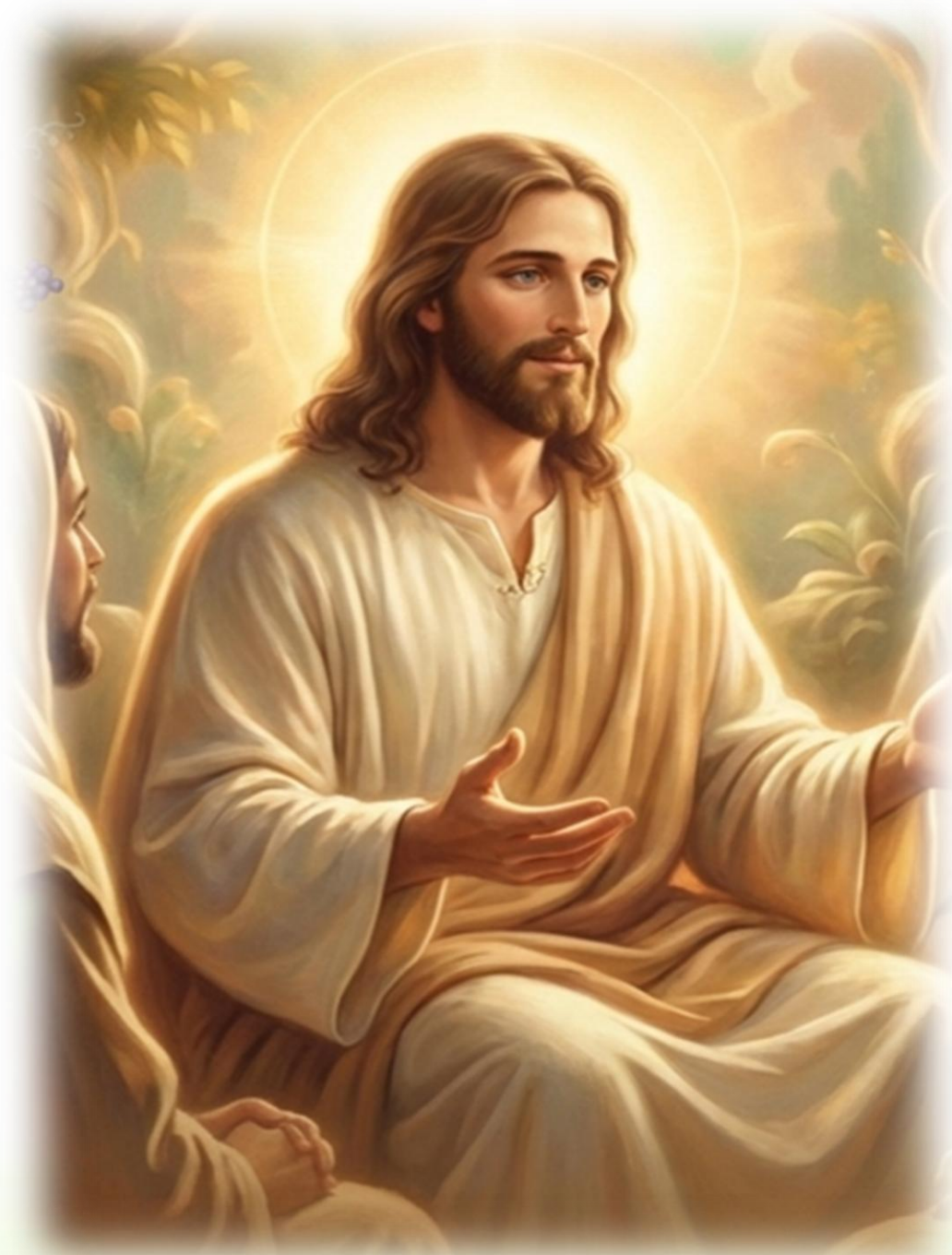
Figura gerada IA NotebookLM em 20/03/26

A resposta do Mestre: “A ordem para nós não é matar para renovar, mas sim de servir para melhorar e elevar sempre. ”