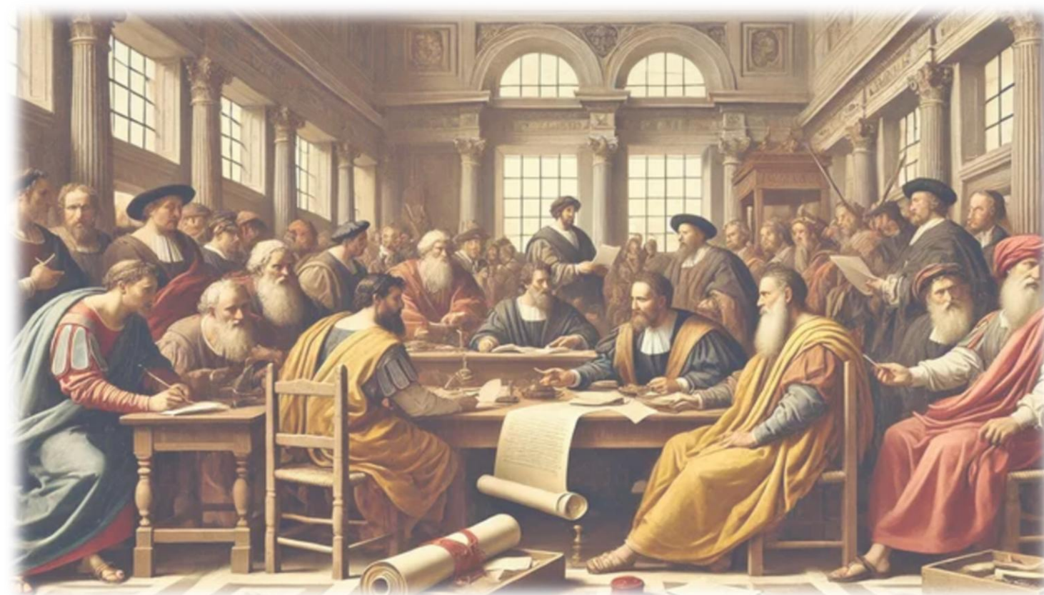
Figura gerada IA NotebookLM 20/03/26

... O Evangelho deveria chegar como a mensagem eterna do amor, da luz e da verdade para todos os seres....” Emmanuel.”