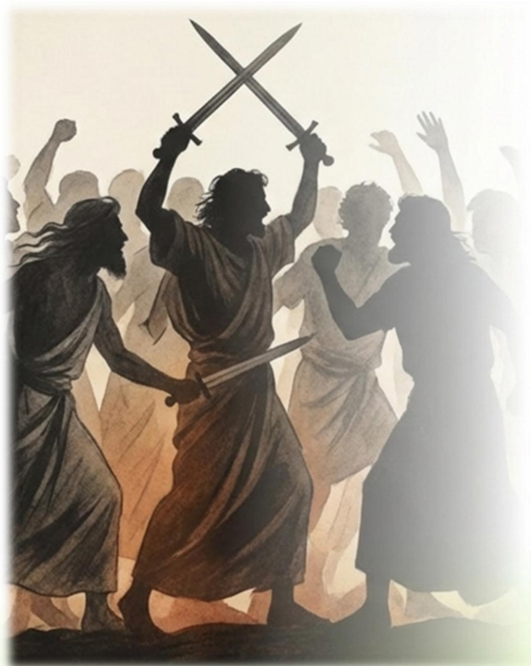
Figura gerada IA NotebookLM em 20/03/26

Irmão X (Humberto de Campos) relata que o apóstolo o Tomé e o povo Judeu esperavam uma renovação política centrada na destruição do império do mal da força exterior, da ruptura governamental e do combate físico.