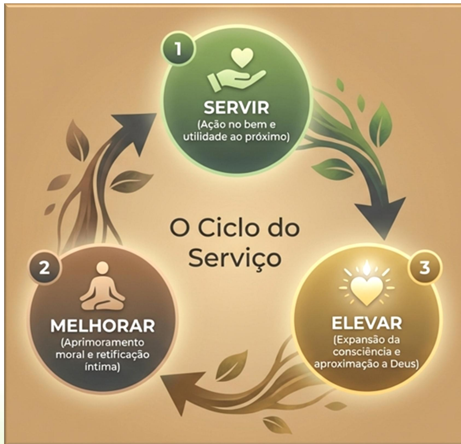
Figura gerada IA NotebookLM em 20/03/26

A transformação não é um evento único e destrutivo, mas um processo orgânico e contínuo. Assim como a semente germina, cada ato de serviço, genuíno gera melhoria íntima, que por sua vez eleva o Espírito, preparando-o para servir com ainda mais amor. Deixar Jesus entrar em nossa intimidade. Contribuindo na transição planetária