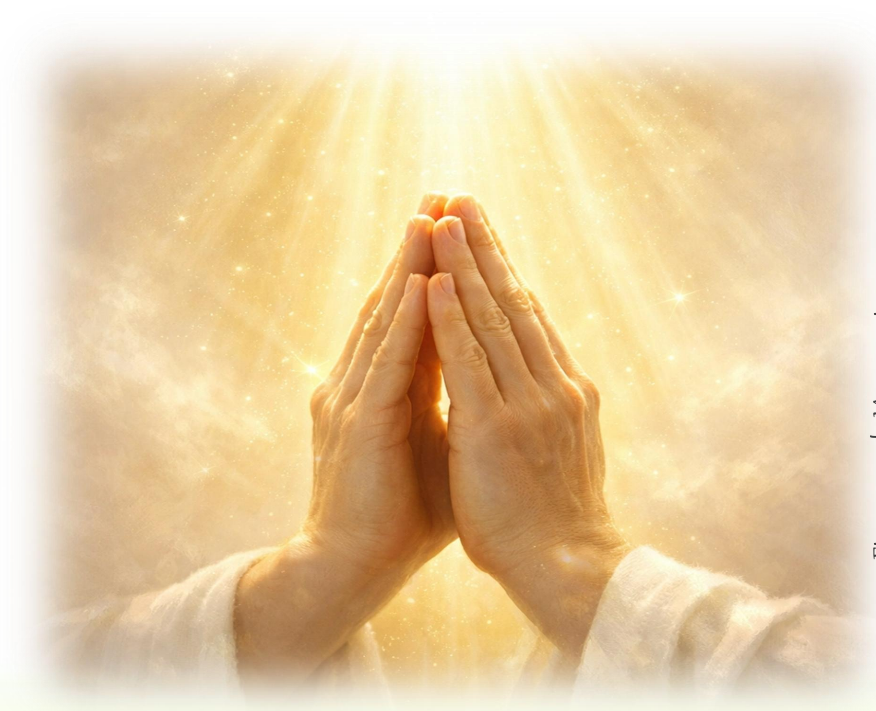
Figura gerada IA manus.im em 20/03/26