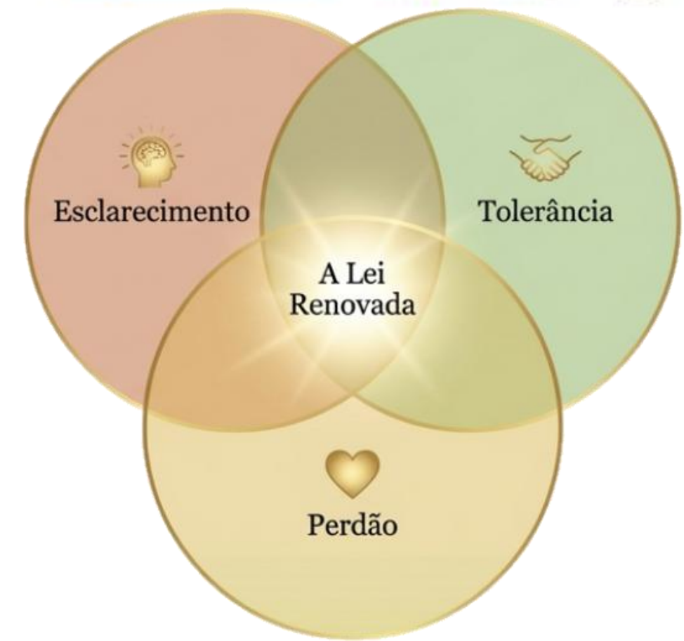
Figuras gerada IA NotebookLM em 20/03/26

Se tendes amor, tereis colocado o vosso tesouro lá onde os vermes e a ferrugem não o podem atacar e vereis apagar-se da vossa alma tudo o que seja capaz de lhe conspurcar a pureza; sentireis diminuir dia a dia o peso da matéria e, qual pássaro que adeja nos ares e já não se lembra da Terra, subireis continuamente, subireis sempre, até que vossa alma, inebriada, se farte do seu elemento de vida no seio do Senhor. – Um Espírito protetor. (Bordeaux, 1861.) 1