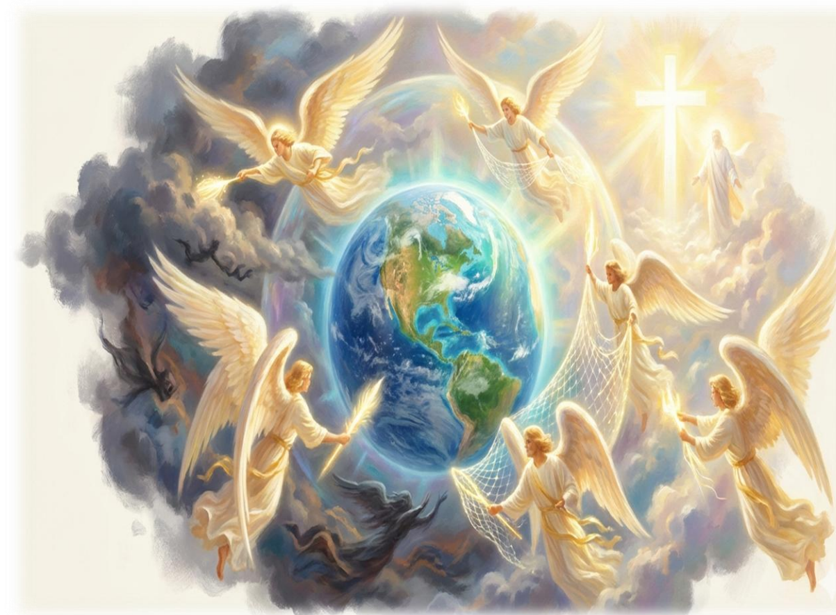
Figura gerada IA google em 21/03/26