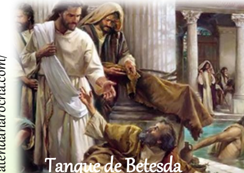
Tanque de Betesda