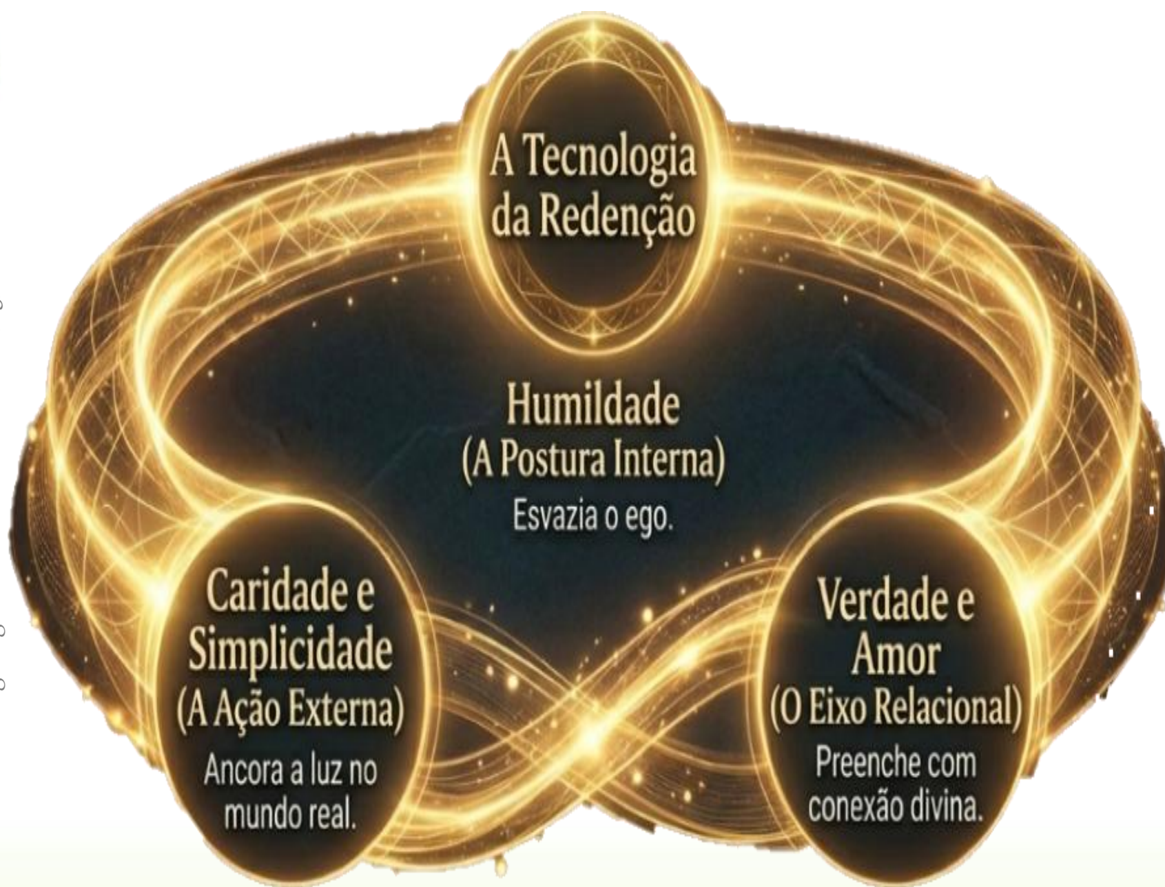
Figura gerada IA NotebookLM em 20/03/26

“De suas lições inesquecíveis, decorrem consequências para todos os departamentos da existência planetária, no sentido de se renovarem os institutos sociais e políticos da Humanidade, com a transformação moral dos homens dentro de uma nova era de justiça econômica e de concórdia universal”.