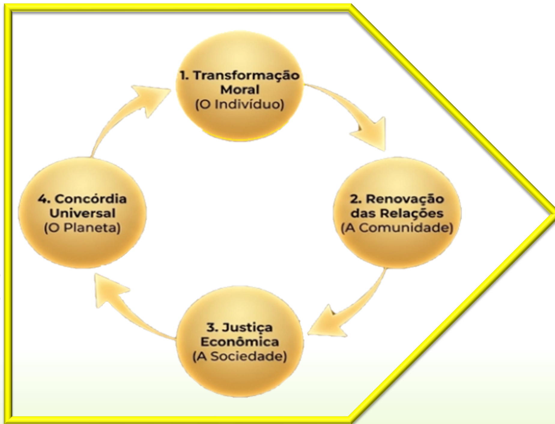
Figura gerada IA NotebookLM em 20/03/26