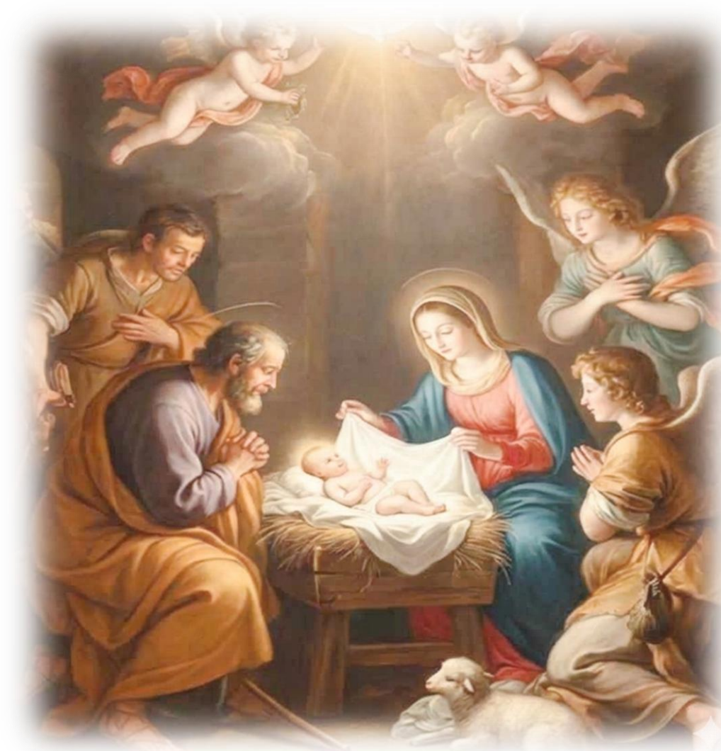
Figura gerada IA NotebookLM em 20/03/26 e suavizada pela IA google