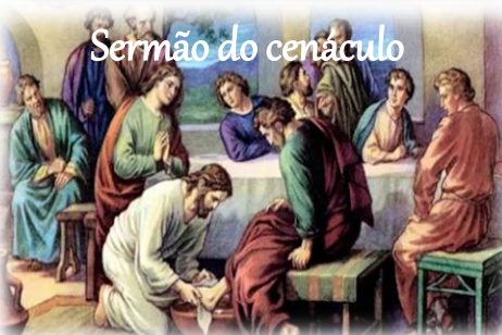
Sermão do cenáculo