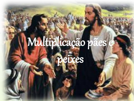
Multiplicação pães e peixes